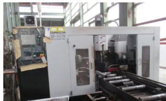
自動測長付穴あけ&切断複合機