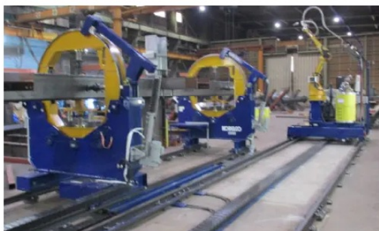
鉄骨柱大組立溶接ロボット