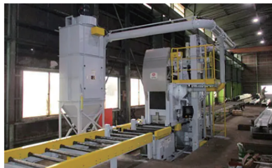
ショットブラスト